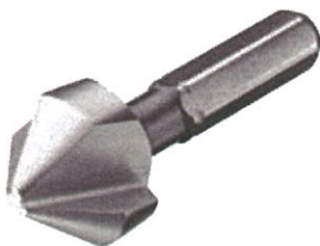
HSS-Kopfsenker BSW 506