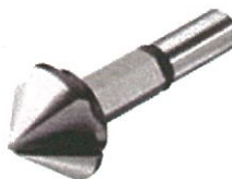
HSS-Kopfsenker BSW 903